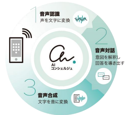
『AI コンシェルジュ®』サービスイメージ

通話時に人の発する言葉を音声認識でテキスト化し、辞書やデータベースと連携して適切な回答を抽出、音声合成によって回答する AI ソリューションです。受電・架電どちらも対応可能なため、様々な電話業務を自動化することが可能です。