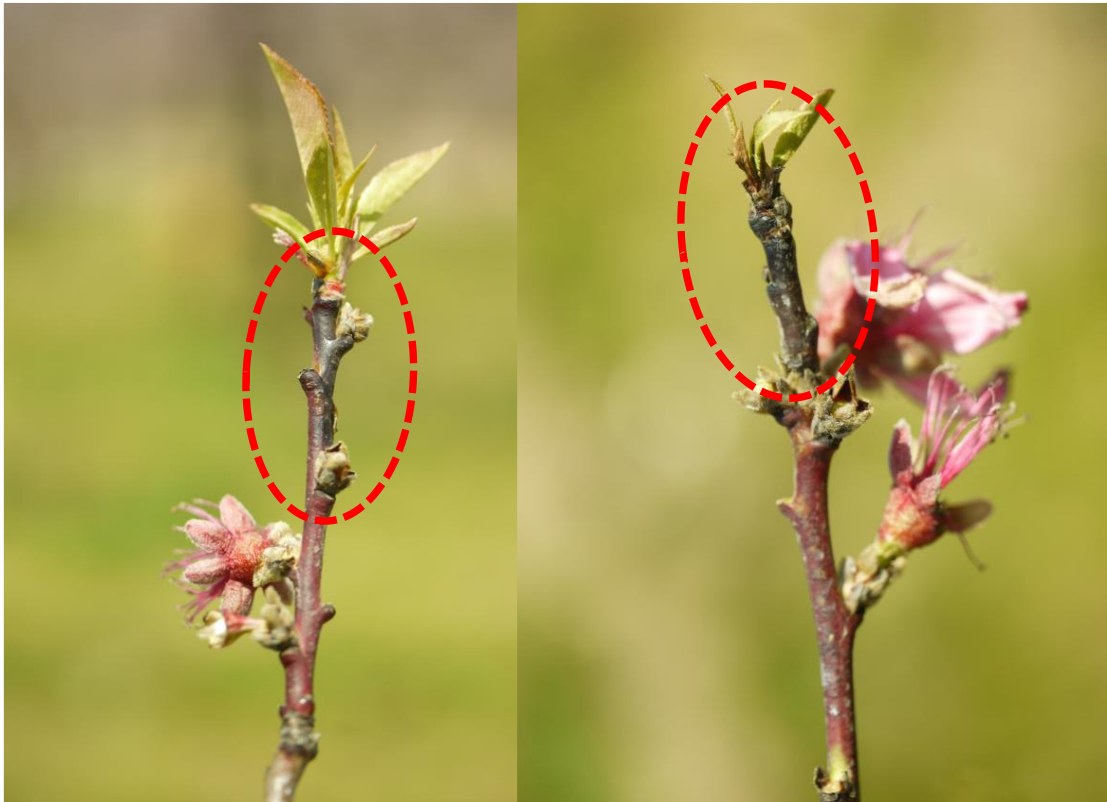
● 枝先に発生した春型枝病斑（令和3年4月12日撮影）